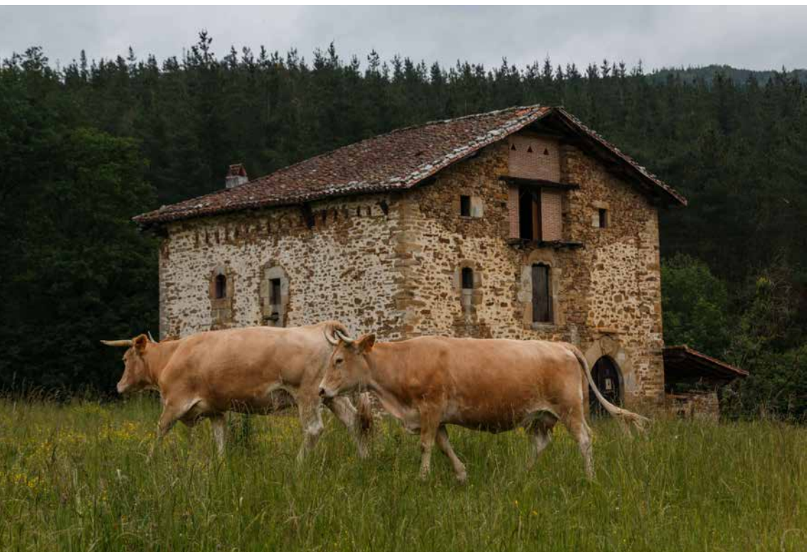
"Amurrio, Mariaka Dorretxe 2" por Ebaki bajo una licencia Creative Commons BY-SA, en Wikimedia Commons